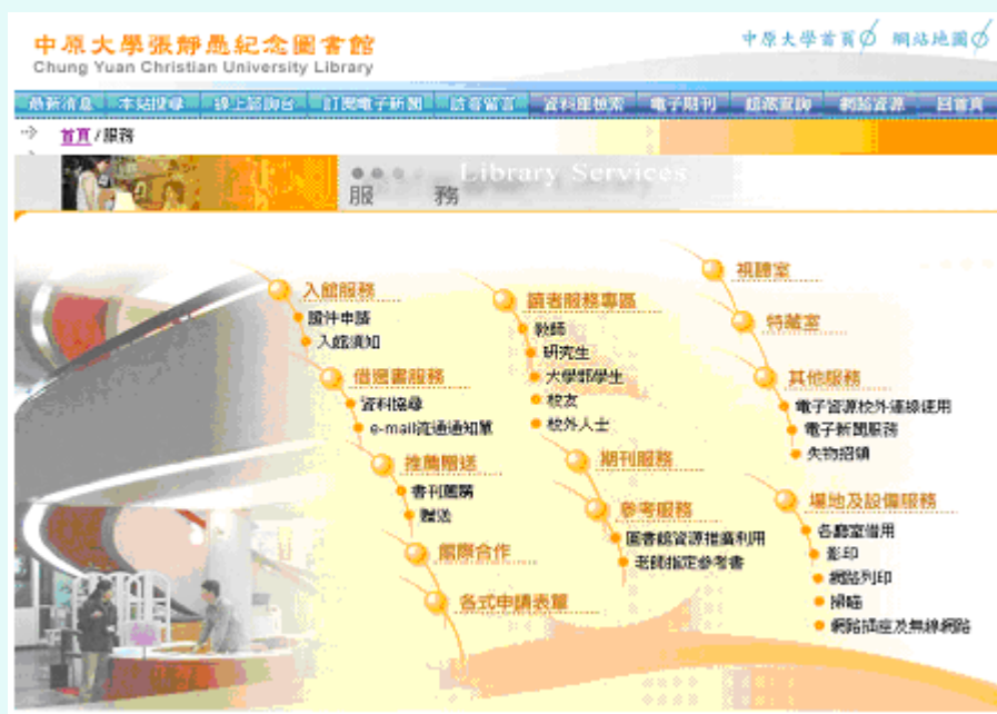
圖(三) 「服務」的索引頁