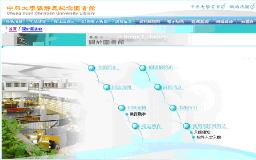
圖(二) 「關於圖書館」的索引頁